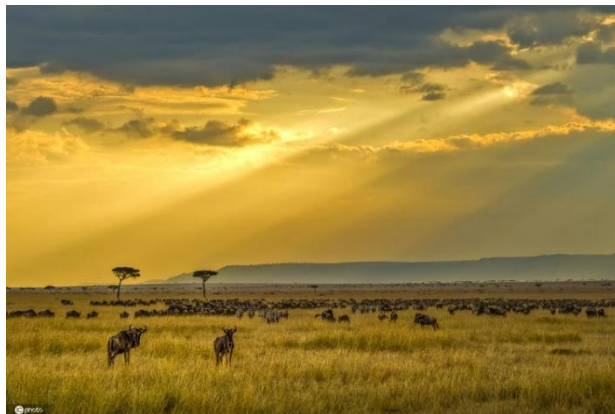
图 3 肯尼亚风景

肯尼亚实行以私营经济为主体的“混合型经济”体制，私营经济在整体经济中所占份额超过 70%。农业是肯尼亚国民经济的支柱产业，2020 年农业增加值占 GDP 的 35.1%。肯尼亚的三大出口创汇产品分别是茶叶、园艺产品和咖啡。据肯《2021 年经济调查》数据，2020 年肯尼亚交通和仓储业产值下降 7.8%，占 GDP 比例为 10.8%。据肯尼亚《2021 年经济调查》，2020 年肯尼亚信息通信技术 (ICT) 行业产值增长 2.5% 至 5383 亿肯先令，较 2019 年 5.8% 的增速有所放缓。